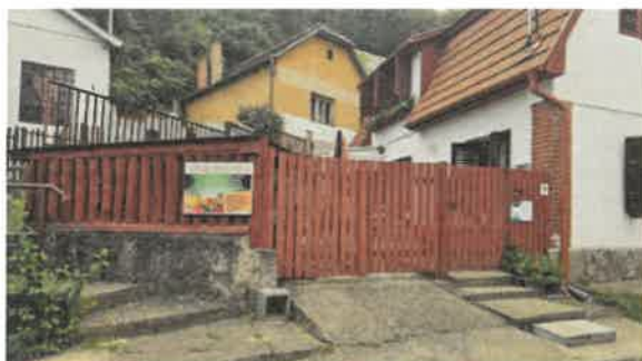
Salamin Ferenc főépítész